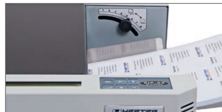
Einfache Bedienung und individuelle Einstellung der Papierstärke

Die fertig geschnittenen Endformate werden in einer universell einstellbaren Ablage sauber abgelegt und können von dort bequem entnommen werden. Extrem langlebige Längs- und Quermessereinheiten sorgen auch bei einer hohen Anzahl von Schnitten stets für ein professionelles Erscheinungsbild!