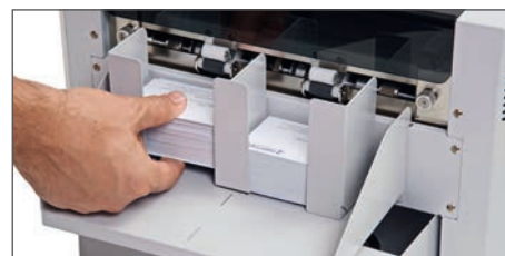
Universell einstellbare magnetische Ablage