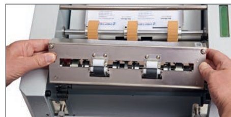
Die Messerkassette kann sehr einfach entnommen und gewechselt werden z.B. für Perforier- oder Rillmesser